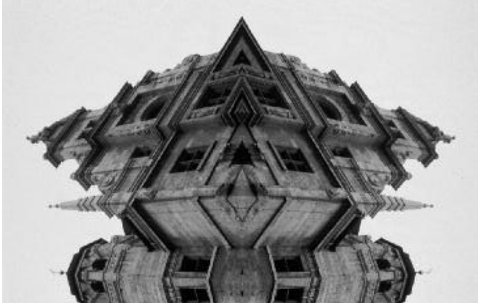
Architectonic #3 Digital Photograph 20" x 30" 1999