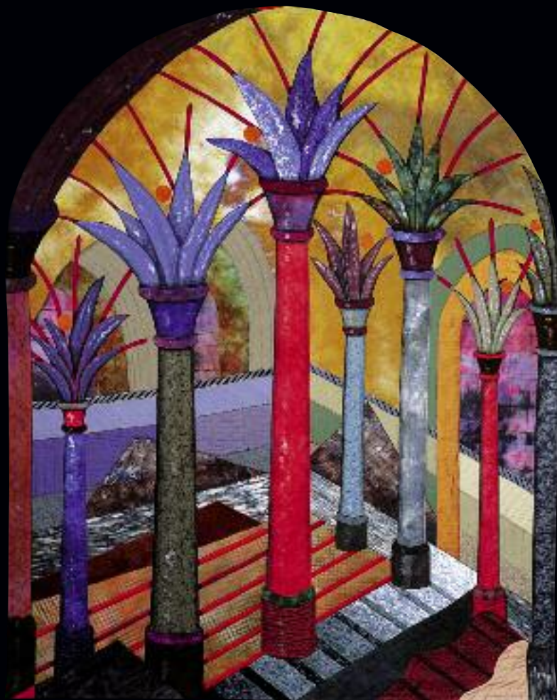
Hopescape XVIII 87" x 68"