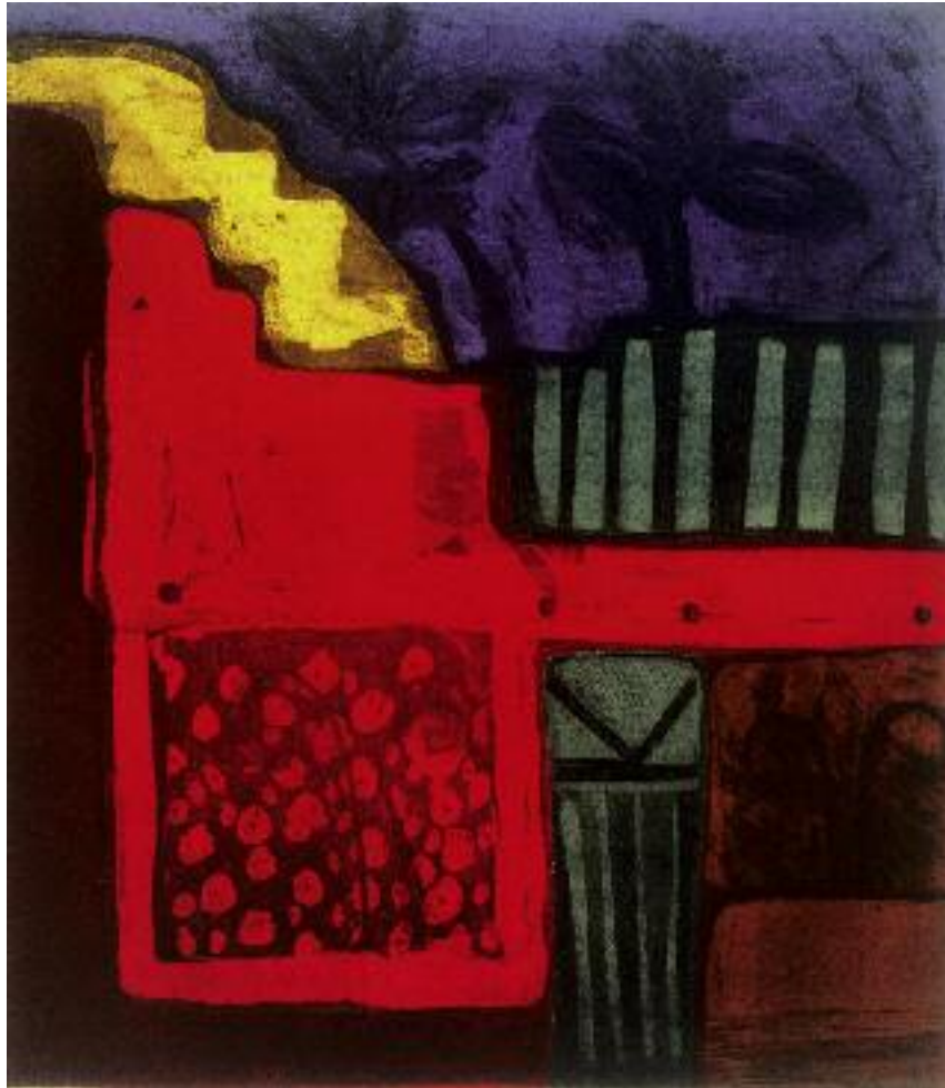
Santa Fe Memory etching and aquatint 18" x 20"