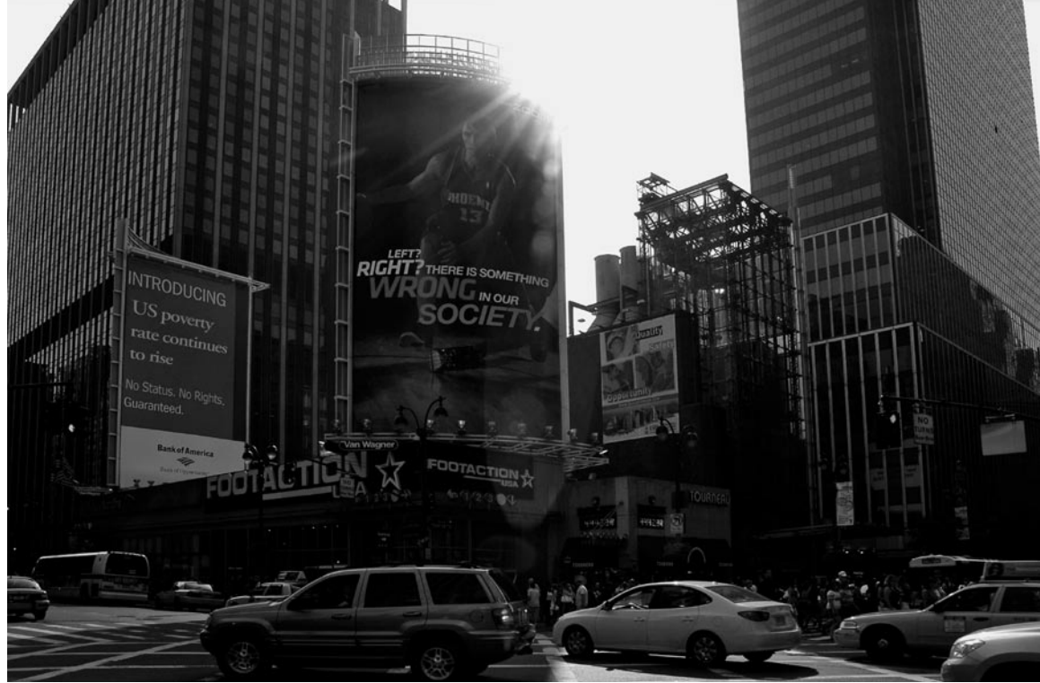
Left? Right? Wrong Fotografie aus der Serie The Public Needs RG 2007

aus Provokation und Humor, Phantasie und Praxisnähe. So beschäftigten sie sich in einer ihrer frühesten Arbeiten mit dem lokalen Arbeitsamt, wo sie auf der Grundlage von Befragungen diverse Logos entwickelten. Beschilderungen auch schon da. Überhaupt, die ambivalente Rolle von Erwerbsarbeit als gesellschaftliches Regulativ ist eines ihrer Lieblingsthemen und hat die beiden Künstler zu spannenden interdisziplinären Kooperationen geführt, die mit der Teilnahme von Arbeitspsychologen, Unternehmern und natürlich Arbeitnehmern weit über das Feld von Kunst