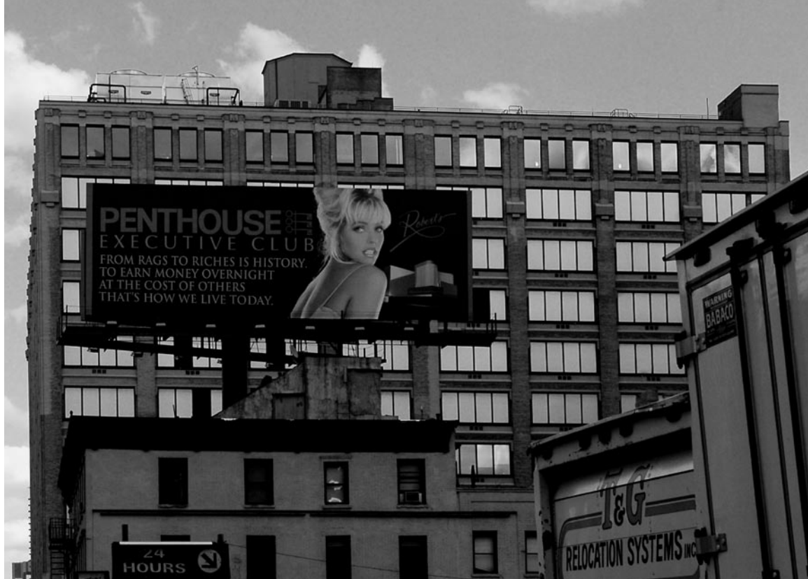
NYC's newest and most upscale Gentlemen's Club Fotografie (Detail) aus der Serie The Public Needs RG 2007

labor as a regulatory force within society has been one of their favorite topics, leading the two artists into interdisciplinary co-operations with industrial psychologists, businesspeople, and of course employees, taking them beyond the fields of art and culture, and beyond creative fiction. In these projects, they see themselves as equal co-producers.