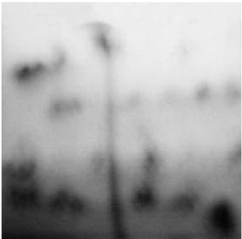
EASTON mall polaroid